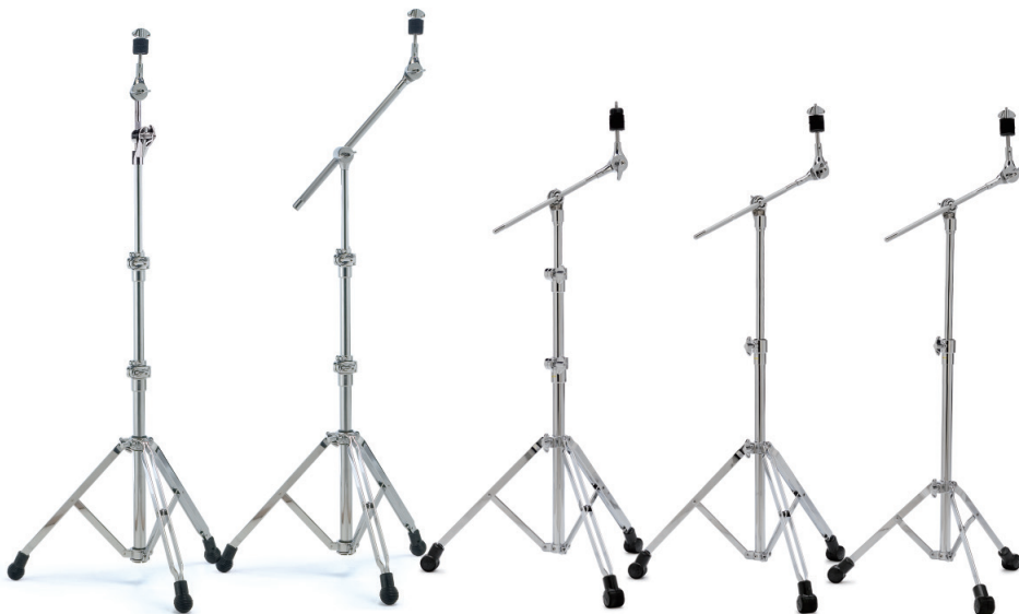
[600シリーズ] SN-MBS673MC ¥34,000+税 ●格納式ブームアーム: 全長485mm, リトラクタブル・アーム [600シリーズ] SN-CBS672MC ¥38,000+税 ●ブームアーム全長: 400mm [4000シリーズ] SN-MBS4000 ¥16,500+税 ●格納式ブームアーム: 全長285mm [2000シリーズ] SN-MBS2000V2 ¥13,000+税 ●格納式ブームアーム: 全長285mm [2000シリーズ] SN-MBSLT2000V2 ¥12,000+税 ●格納式ブームアーム: 全長285mm シングルレグ・ライトウェイト仕様 フラットベース・セッティングも可能です。