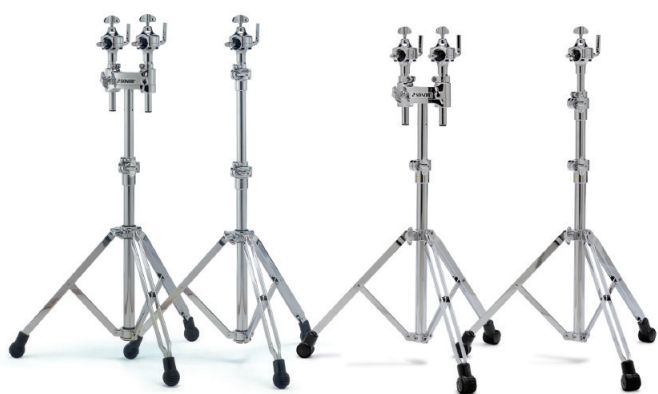
[600シリーズ] SN-DTS675MC ¥39,000+税 ●ダブル・タム・スタンド [600シリーズ] SN-STS676MC ¥34,000+税 ●シングル・タム・スタンド [4000シリーズ] SN-DTS4000 ¥24,000+税 ●ダブル・タム・スタンド [4000シリーズ] SN-STS4000 ¥18,000+税 ●シングル・タム・スタンド