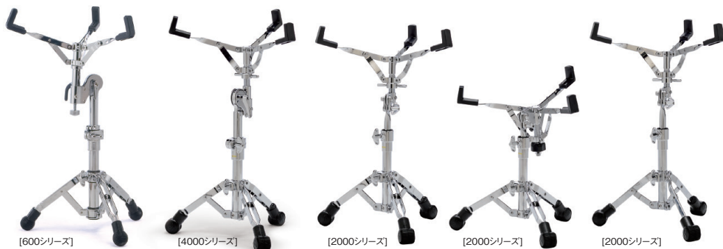
[600シリーズ] SN-SS677MC ¥33,000+税 ●角度調整・無段階 ●クイック・リリース・レバー付 ●高さ調節幅: 490mm~730mm [4000シリーズ] SN-SS4000 ¥14,000+税 ●角度調整・無段階 ●高さ調節幅: 490mm~660mm [2000シリーズ] SN-SS2000 ¥11,000+税 ●高さ調節幅: 470mm~640mm [2000シリーズ] SN-SSXS2000 ¥11,000+税 ●ローポジション仕様 ●高さ調節幅: 380mm~540mm [2000シリーズ] SN-SSLT2000 ¥10,500+税 ●シングル・レグ・ライトウェイト仕様 ●高さ調節幅: 470mm~640mm フラットベース・セッティングも可能です。