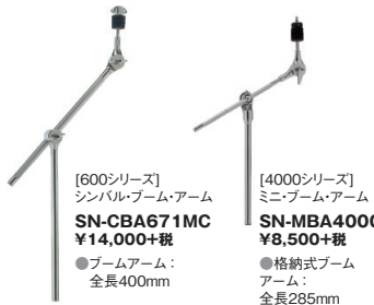
[600シリーズ] シンバル・ブーム・アーム SN-CBA671MC ¥14,000+税 ●ブームアーム: 全長400mm [4000シリーズ] ミニ・ブーム・アーム SN-MBA4000 ¥8,500+税 ●格納式ブームアーム: 全長285mm