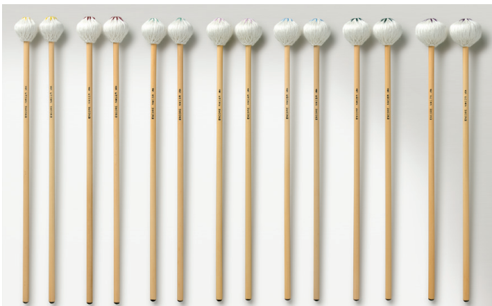
EM-NMC1R EM-NMC2R EM-NMC3R EM-NMC4R EM-NMC5R EM-NMC6R EM-NMC7R