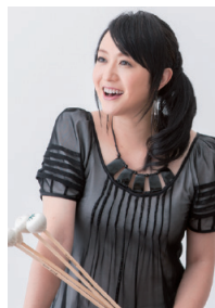
三村奈々恵 マリンピスト／ヴィブラフォニスト