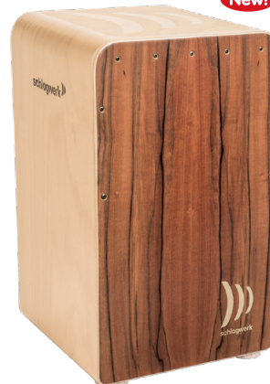
ファインライン・コンフォート “ティネオ” SR-CP609 ¥81,000+税