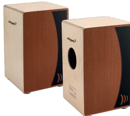
アジャイル“デュアル” SR-CP555 ¥37,500+税