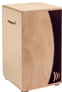
アジャイル“ナチュラル” SR-CP550 ¥28,500+税