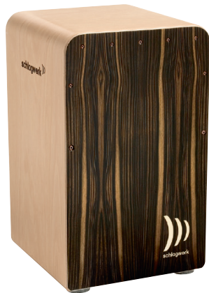
ファインライン・コンフォート “モ力” SR-CP604 ¥81,000+税

コイル状に巻かれたカスタム・ワウンド・ワイヤー(Custom Wound Wire=CW2)が計12本。“ラ・ペル”シリーズのテクニックをベースにしたポジショニングで、張りの調節も可能。センシティブなレスポンスを実現します。