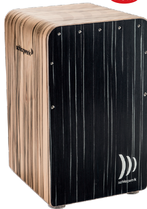
ファインライン・コンフォート “ダーク・ナイト” SR-CP608 ¥81,000+税

丸みのあるタイトで落ち着いたサウンドは、絶妙なバランス。レゾナンス・ボックスの豊かな鳴り、余裕たっぷりなまとめています。