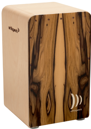
ファインライン・コンフォート “モラード” SR-CP605 ¥81,000+税

パワープレイにも、ファインライン・スネアの繊細なタッチにも“フルボディ”のサウンドで応えます。キレのある高音と重厚な低音は圧巻です。