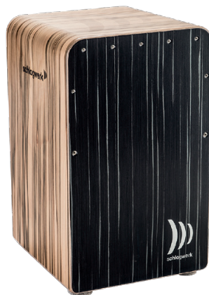
ファインライン・コンフォート “ダーク・ナイト” SR-CP608 ¥81,000+税

丸みのあるタイトで落ち着いたサウンドは、絶妙なバランス。レゾナンス・ボックスの豊かな鳴りが、余裕たっぷりにとまっています。