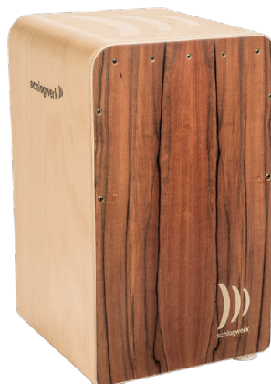
ファインライン・コンフォート “ティネオ” SR-CP609 ¥81,000+税