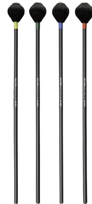
MB-B221BB MB-B222BB MB-B223BB MB-B224BB