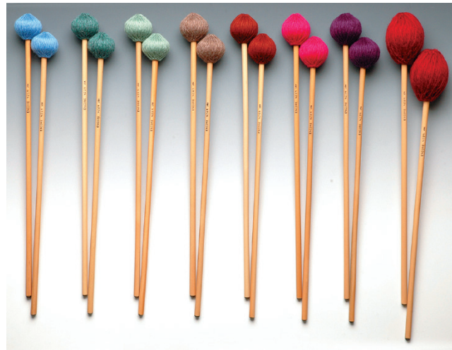
EM-NZ1R EM-NZ2R EM-NZ3R EM-NZ4R EM-NZ5R EM-NZ6R EM-NZ7R EM-NZ8R

●毛糸：100%ソフト・ヨーロッパ産ウール使用 ●柄：ロング・シャフト ●ヘッド芯：ラテックス巻きディスク形コア