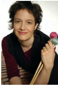
ナンシー・ゼルトzman マリンビスト

アメリカのマリンビスト、ナンシー・ゼルトzman氏の監修により誕生したシグネチャー・マリンバ・マレットです。トラディショナルな奏法を提唱する彼女のデザインのマレットは、日本のマリンビストのフィーリングにも近く、細やかな音づくりを可能にします。