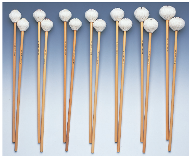
EM-NM1R EM-NM2R EM-NM3R EM-NM4R EM-NM5R EM-NM6R EM-NM7R

●毛糸：100%北米産ウール使用 ●柄：ロング・シャフト ●ヘッド芯：ラテックス巻きディスク形コア