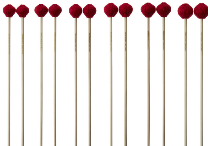
EM-KANA1R EM-KANA2R EM-KANA3R EM-KANA4R EM-KANA5R EM-KANA6R