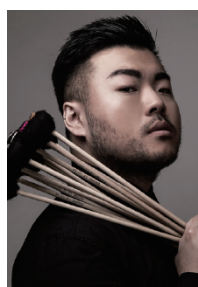
レ・ユウ マリニスト