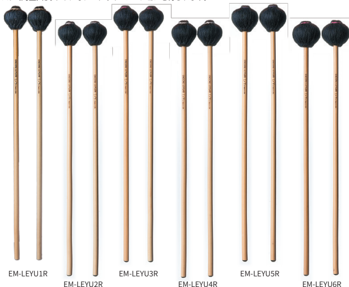
EM-LEYU1R EM-LEYU2R EM-LEYU3R EM-LEYU4R EM-LEYU5R EM-LEYU6R