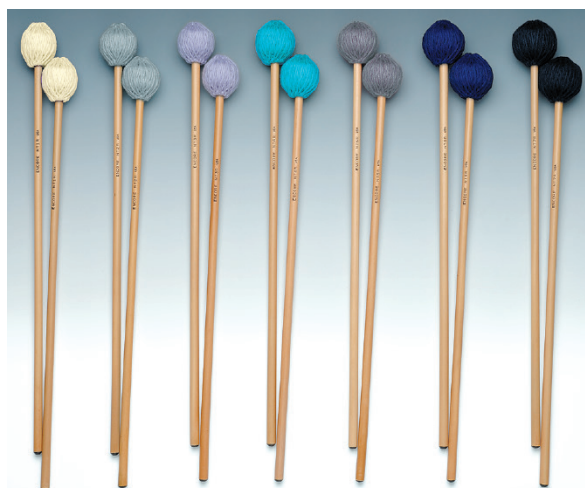
EM-NT1R EM-NT2R EM-NT3R EM-NT4R EM-NT5R EM-NT6R EM-NT7R