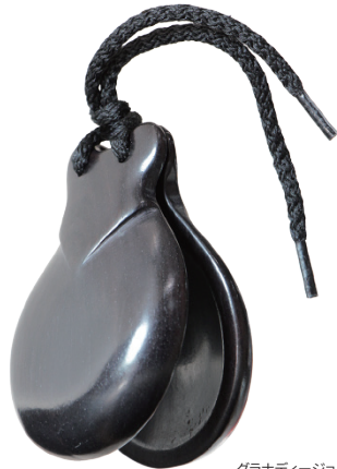
グラナディージョ

グラナディージョ: フラメンコ・カスタネットの伝統的な王道の素材。今や高級材であるグラナディージョの無垢板を削り出して成形。天然素材ならではの一つ一つの個性が光ります。