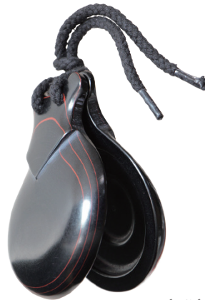
フィブラ・ドブレ

フィブラ・ドブレ: フィブラ製で、カスタネット内側の削り方が2段(=ドブレ)になっています。内部の容積が大きくなり、より深みのあるサウンドです。赤いラインは材料の積層構造から表出する仕様。