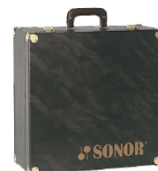
付属トランクケース