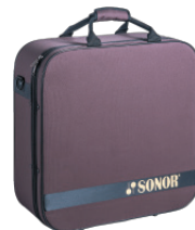
“スーパーライト”ドラムケース付属