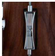
元祖“フォニック・スタイル”ラグ (チューンセーフ内蔵)