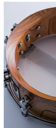
厚み24.5mmの割り貫きの櫻材シェル。真正正銘の1ピース胴。

※良品の櫻原木が採取された時のみ製造されます。また希少材につき、生産数が限られる為、在庫切れの期間が長期に渡る事があります。あらかじめご了承ください。