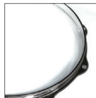
ダイキャスト・フープ