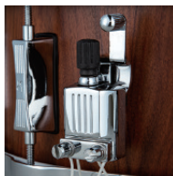
スローオフストレイナー