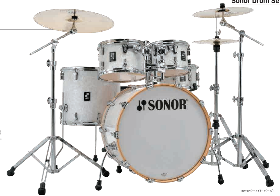
#WHP(ホワイト・パール)