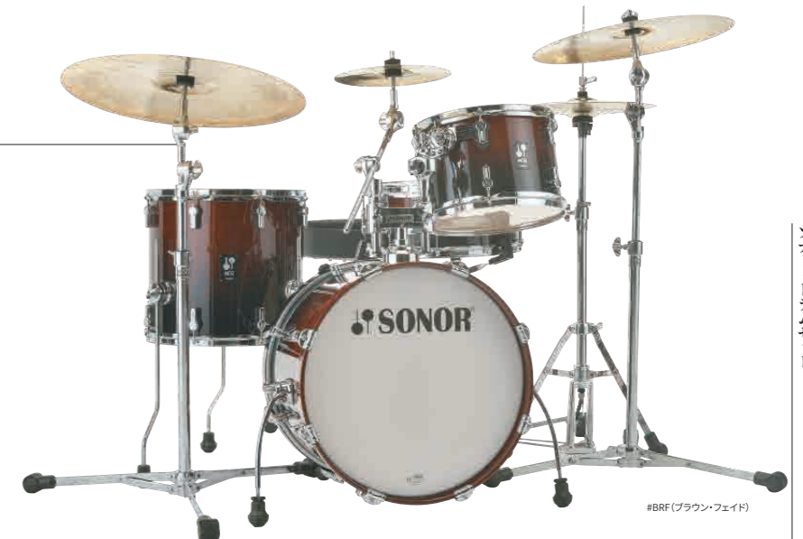
#BRP(ブラウン・フェイド)