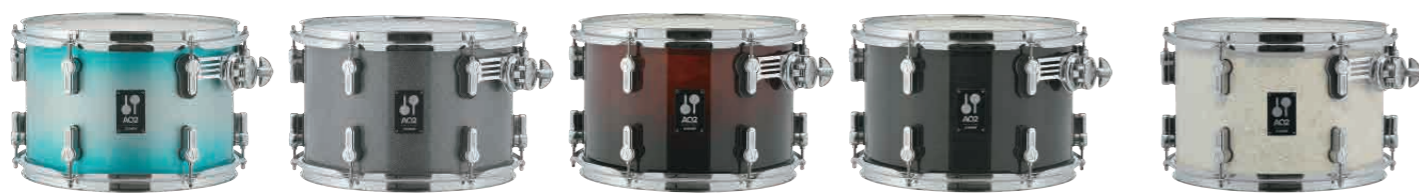
ASB アクア・シルバー・バースト