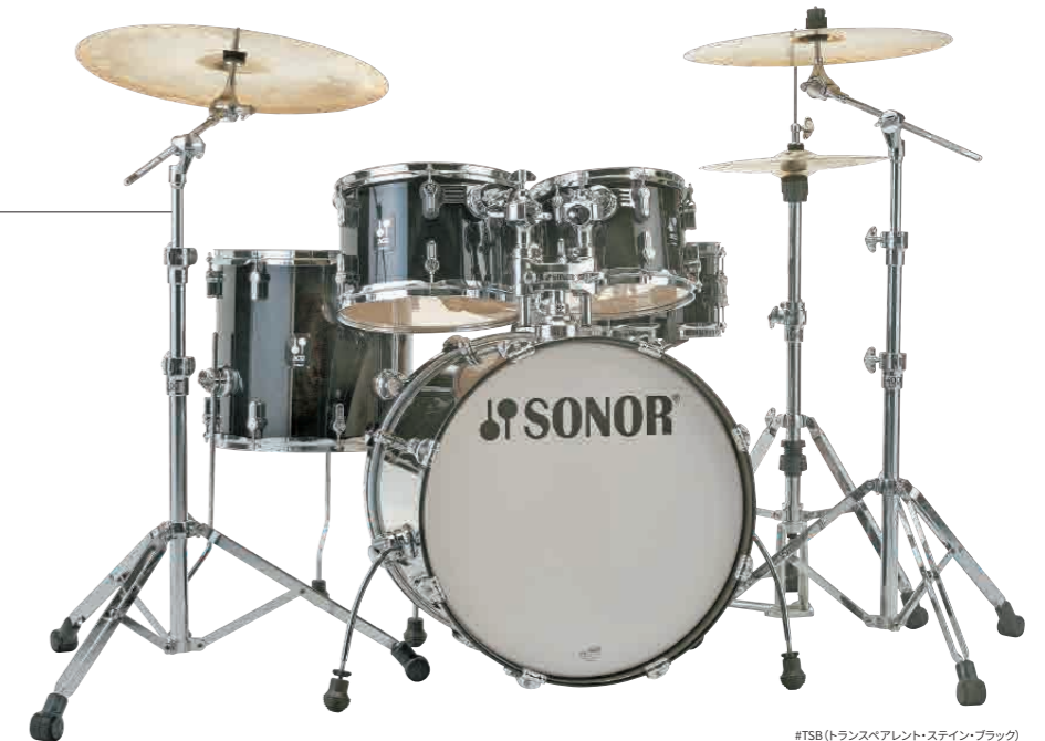
#TSB(トランスベアレント・ステイン・ブラック)