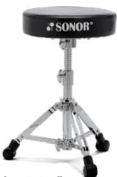
[2000シリーズ] SN-DT2000 ¥19,800 (税抜¥18,000) ●ラウンド・シート/スクリュー式高さ調節 ●座面高さ調節幅:440mm~600mm