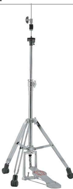
[2000シリーズ] SN-HH2000S ¥22,000 (税抜¥20,000) ●ダブル・レッグ