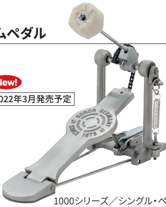
1000シリーズ/シングル・ペダル SN-SP1000S ¥9,680 (税抜¥8,800) ●シングル・チェーン・ドライブ