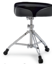
[6000シリーズ] SN-DT6000ST ¥55,000 (税抜¥50,000) ●サドル・シート/スクリュー式高さ調節 ●座面高さ調節幅:460mm~660mm