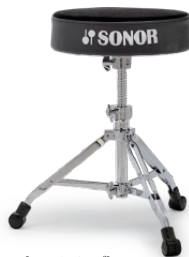
[4000シリーズ] SN-DT4000 ¥27,500 (税抜¥25,000) ●ラウンド・シート/スクリュー式高さ調節 ●座面高さ調節幅:460mm~620mm