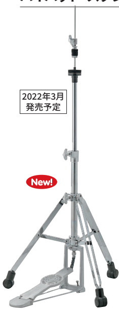
[1000シリーズ] SN-HH1000S ¥15,400 (税抜¥14,000) ●ダブル・レッグ