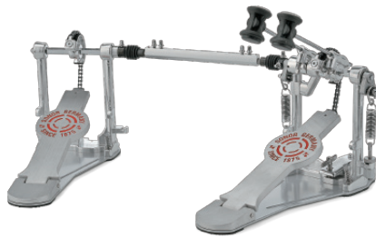
2000シリーズ/ダブル・ペダル SN-DP2000S ¥42,900 (税抜¥39,000) ●シングル・チェーン・ドライブ ●連結シャフト長さ:296~390ミリ ●付属品:ペダルバッグ