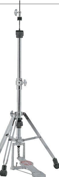
[4000シリーズ] SN-HH4000S ¥24,200 (税抜¥22,000) ●ダブル・レッグ、スプリング調整、ヘキサゴン・ブルロッド