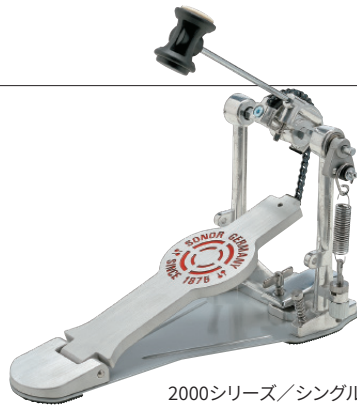
2000シリーズ/シングル・ペダル SN-SP2000S ¥14,300 (税抜¥13,000) ●シングル・チェーン・ドライブ