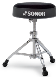
[6000シリーズ] SN-DT6000RT ¥52,800 (税抜¥48,000) ●ラウンド・シート/スクリュー式高さ調節 ●座面高さ調節幅:460mm~660mm