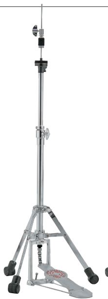
[2000シリーズ] SN-HHLT2000S ¥16,500 (税抜¥15,000) ●シングル・レッグ・ライト・ウェイト仕様