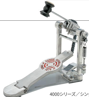
4000シリーズ/シングル・ペダル SN-SP4000S ¥20,900 (税抜¥19,000) ●ヒールプレート:ボールベアリング・ヒンジ ●ダブル・チェーン・ドライブ ●付属品:ペダルバッグ