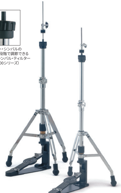
[600シリーズ] SN-HH674MC ¥75,900 (税抜¥69,000) ●ダブル・レッグ、スプリング調整、ヘキサゴン・ブルロッド

ハイハット・シンバルの角度を7段階で調節できるボトム・シンバル・テイルター(600・4000シリーズ)