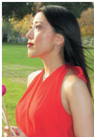
高田直子 マリニスト/ヴィブラフォニスト