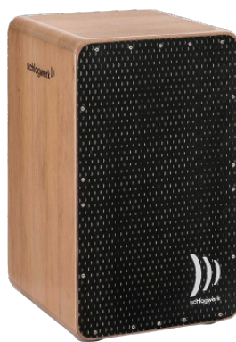
プリサイスOSカホン“EVO” “EVO ブラック”

打面を完全ネジ止めにする事で、オープンなサウンドを実現したプリサイスOS。(OS=Open sound and fully Screwed surface)側面はアルダー材、背面にはビーチ材を採用し、ドライで非常に特徴的なアタックサウンドを実現。低音域を補完する為に、SR-CP5901のみカホン・ベースチューブ(SR-CBT10)が付属します。