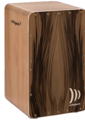
プリサイスOSカホン“EVO” “EVO ウォールナット・デラックス”