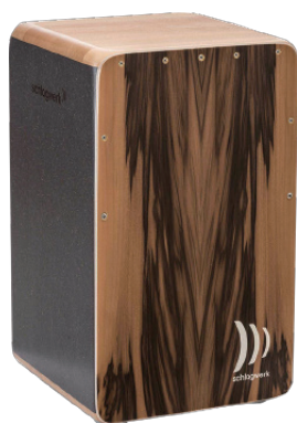
カホン・ラ・ペルー“EVO” “EVO ウォールナット・デラックス”