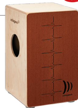
アジャイル “デュアル・レッド”