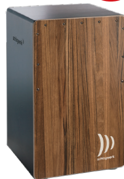
スーパーアジャイル “ブラウン・シュガー”