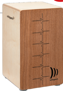
アジャイル “ベース・ネイチャー”