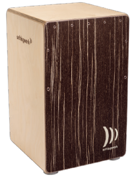
スーパーアジャイル “カブチーノ”