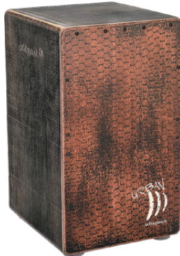
アーバンOSカホン “オールド・レッド”