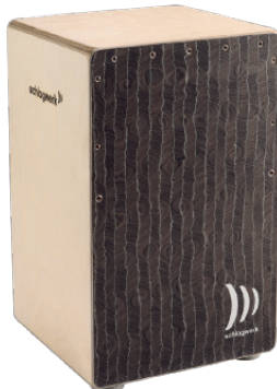
スーパーアジャイル “シルバーライニング”