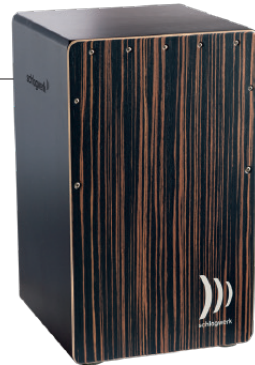
デラックス“エボニー”