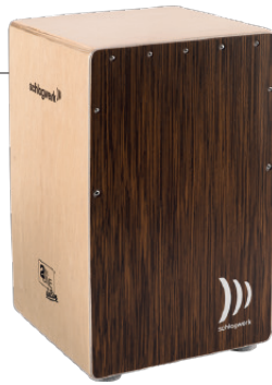
デラックス“ウェンジ”