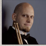
■ジョエル・ビードリック 名古屋フィルハーモニー交響楽団首席打楽器奏者