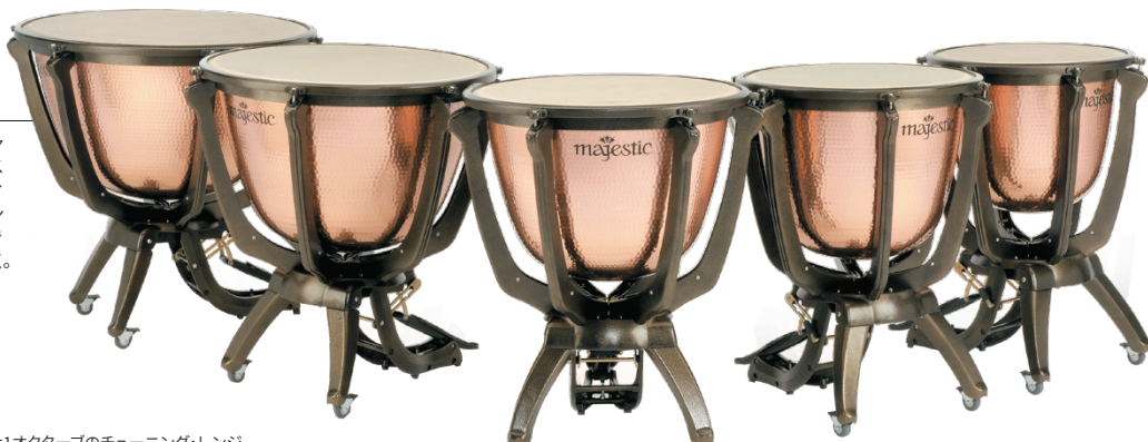
※写真はハンマード・コパー・ケトル仕様です。

プロフォニック・シリーズ・ティンパニは、深いキャンパード・スタイルのコパー・ケトルを、フリーサスペンションのフレームに搭載したポータブル・ティンパニです。ポータビリティとハイエンドのサウンド・クオリティをしっかりと両立させました。個人でティンパニを所有するなら、ここがひとつの到達点。