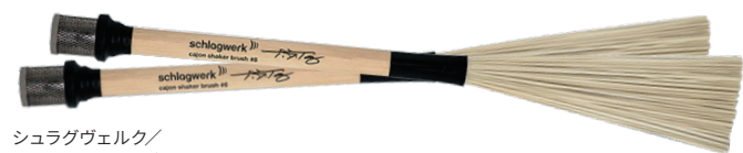
シュラグヴェルク／シェイカー・ブラシ SR-BRC06 ¥11,000 (税抜¥10,000)

●グリップ部:φ15.4mmヒッコリー材、ブラシ部:プリッスル(ミディアム・ハード)グリップエンドにメタルシェイカーが付いたナイロンブラシ。