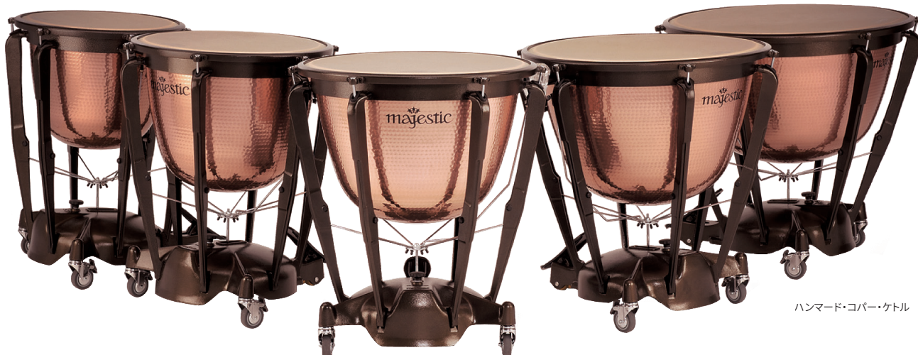
ハンマード・コパー・ケトル

マジェスティックの深いキャンバード・ケトルを、ポピュラーなバランス・スタイルのペダルシステムに組み込んだティンパニ。