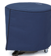
ティンパニ・カバー 各¥18,150(税抜¥16,500)