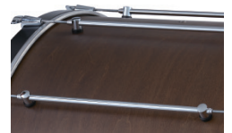
クラシカルなデザインのチューブラグ仕様。