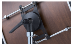
回転式のスタンドは360°どこでもホールド可能です。