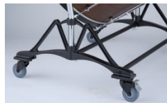
ウェイトの有る堅牢な作りのスタンド。