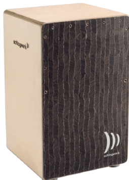
スーパーアジャイル “シルバーライニング”