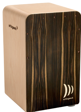
ファインライン・コンフォート “モカ”