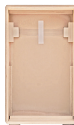
コイル線タイプのシンプル な響き線ユニット

“AGILE”: アジャイルとは機敏、すばやいの意。カホン・アジャイル・シリーズは、コイル線タイプの響き線から極めて早く、タイトな反応を引き出す画期的な構造へと進化したモデルです。