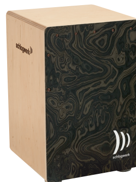
カホン・ラ・ペルー “ナイト・パール, ミディアム”

リッチな低音と力強いクラッシュ音。30年以上の間“モダン・カホン”のスタンダードとして愛されているモデルです。