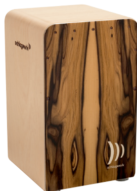
ファインライン・コンフォート “モラード”

パワープレイにも、ファインライン・スネアの繊細なタッチにも“フルボディ”のサウンドで応えます。キレのある高音と濃厚な低音は圧巻です。