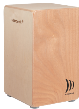
アジャイル “ベース・ネイチャー”