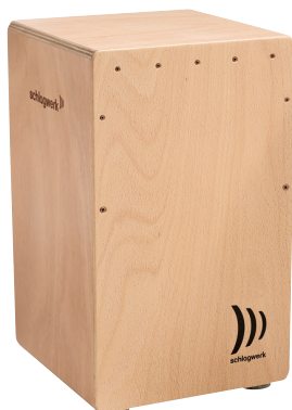
カホン・ラ・ペルー “ピーチウッド”