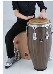
コンガやシェイカーなど、フラスワンが可能になります。

※脚部パーツ(足ゴム等)の高さは、カホンに乗った状態で8mm以上必要です。それより短いものは、底面と擦れてカホンに傷が付く場合があります。