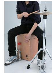
ハイハットを加えて、ドラムセットのニュアンスをよりグルービーに。いつもの踏み方も可能に。